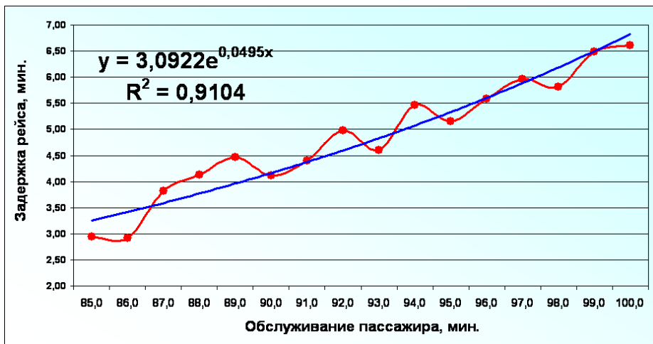
Рис. П1.3. Зависимость времени задержки рейса от времени обслуживания одного пассажира в аэровокзале аэропорта отправления