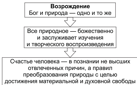
Схема 4.1. Возрождение: общая характеристика

Период развития Европы с начала XIV в. и до конца XVI в. принято называть эпохой Возрождения (Ренессанса) . Это время отмечено выдающимися достижениями во всех областях науки и культуры. Ослабло влияние церкви и религии на духовную жизнь, резко возрос интерес к античному наследию, на первое место выдвигаются проблемы человека, исследования его творческих способностей, его места в природе, прагматического управления обществом (Никколо Макиавелли), независимого от морали и религии, или, наоборот, построения идеального общества (утопии Томаса Мора и Томмазо Кампанеллы) на основе идеи равенства.