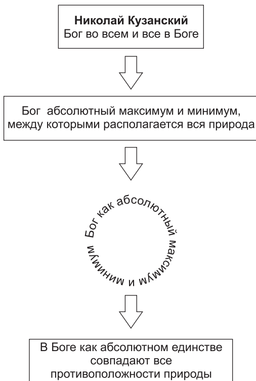
Схема 4.2. Возрождение: Николай Кузанский

Николай Кузанский (подлинная фамилия — Кребс, 1401–1464) — немецкий философ, теолог, астроном, кардинал и легат (представитель папы в Германии). Пантеист. Главный вопрос для Николая Кузанского — может ли человеческий разум выразить в рациональной, математической форме тождество Бога и природы. Предвосхитил коперниканский переворот в астрономии.