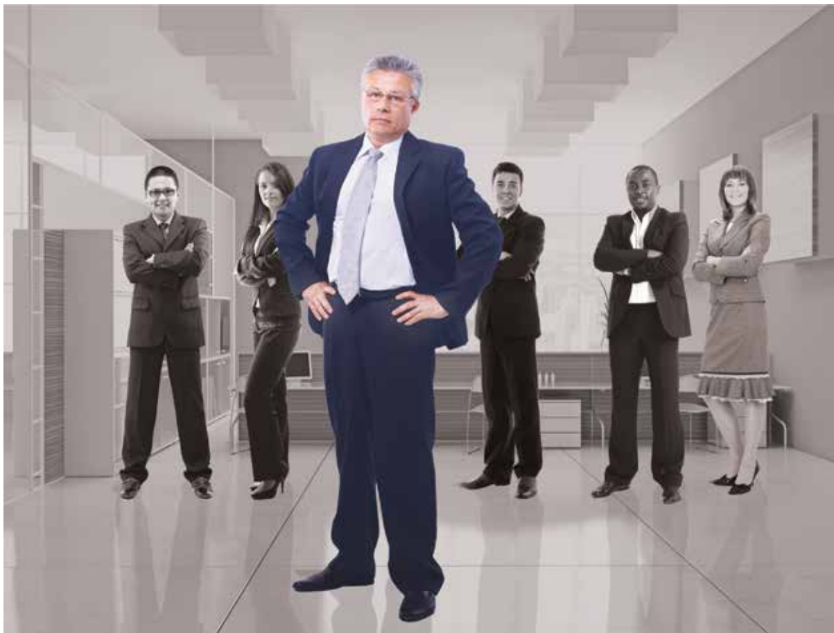
РИС. 10.4. Использование контраста в масштабе подчеркивает важность

Значимость и масштаб. Масштаб или размер — тоже эффективные способы подчеркнуть контраст, когда цель дизайна заключается в передаче значимости. На рис. 10.4 нужный нам человек крупнее, чем другие люди, которые выдвигают его на передний план. Цветовые контрасты также способствуют этому. Большинство зрителей поймут, что самый крупный объект или лицо является наиболее значимым.