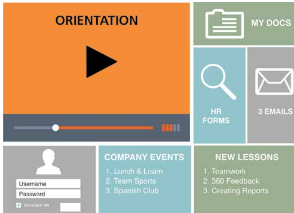
РИС. 10.2. На этом веб-сайте контраст создает акцент и привлекает взгляд, немедленно передавая информацию о том, что видео «Orientation» является наиболее важным

Когда вы размещаете визуальные элементы с противоположными характеристиками в непосредственной близости друг от друга, то контраст между ними заметен сразу. Таким образом, контраст создает акцент. Этому помогают также изображение, форма или текст, доминирующие по сравнению с другими элементами дизайна.