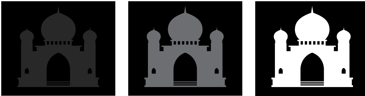
РИС. 10.1. Чем выше контраст, тем легче обнаружить форму

Как известно, объект выделяется из окружающей среды благодаря наличию областей света и темноты, а также краев (Marmor & Ravin, 2009). Степень контрастности определяет, как легко и быстро мы его воспринимаем. Чем выше контрастность и чем острее края, тем легче обнаружить форму. И наоборот: чем ниже контрастность и чем больше края сливаются с фоном, тем труднее выявить формы. На рис. 10.1 приведены примеры степеней контраста.