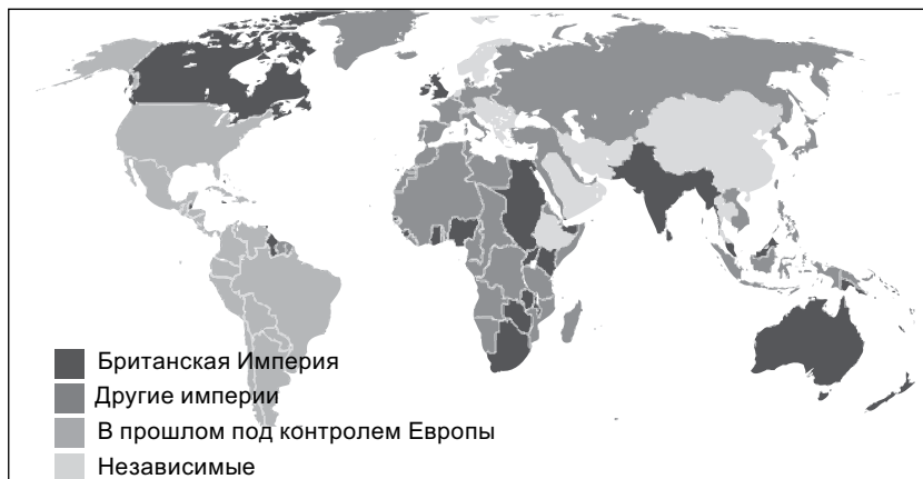
Глобальные колониальные империи по состоянию на 1914 год

ляла десятками миллионов людей там, где сегодня расположена Индонезия, Франция имела свою большую империю в Африке и Индокитае. Кроме этого списка были еще земли, которые формально являлись независимыми от европейских метрополий, но в которых европейцы обладали огромным влиянием, как, например, Египет и Китай.