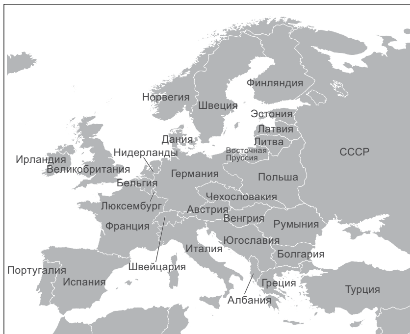
Европа после Первой мировой войны

Германию. Случилось то, что ожидалось меньше всего: распались четыре империи — Германская, Австро-Венгерская, Российская и Османская. А это привело к вычленению новых ярко выраженных наций, которые до того были в большей степени растворены в многонациональных империях.