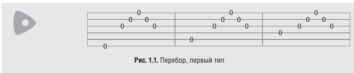
Рис. 1.1. Перебор, первый тип

Упражнение 3. Перебор третьего типа. Еще один широко используемый перебор представлен на рис. 1.3.