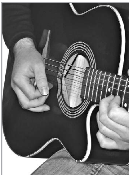
Рис. 1.7. Положение медиатора в руке

Во время игры медиатор держат большим и указательным пальцами правой руки (рис. 1.7). Не нужно сильно сжимать медиатор: держите его свободно, при этом следите, чтобы при исполнении он не вращался и не выпадал. Со временем вы найдете такое положение, при котором будете держать медиатор надежно и уверенно. Главное, чтобы в правой руке не было напряжения.