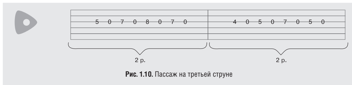
Рис. 1.10. Пассаж на третьей струне

отрабатываете взаимодействие указательного пальца с безымянным и мизинцем, а во второй — указательного со средним и мизинцем. После каждого прижатия следует отпустить всю струну, то есть идет чередование звучания прижатой и неприжатой струны (рис. 1.10). Это довольно распространенный гитарный прием, который называется игрой через открытую струну. В таблатуре открытая струна обозначается нулем.