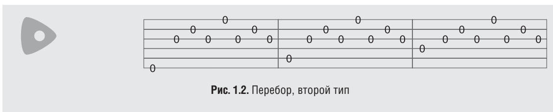
Рис. 1.2. Перебор, второй тип