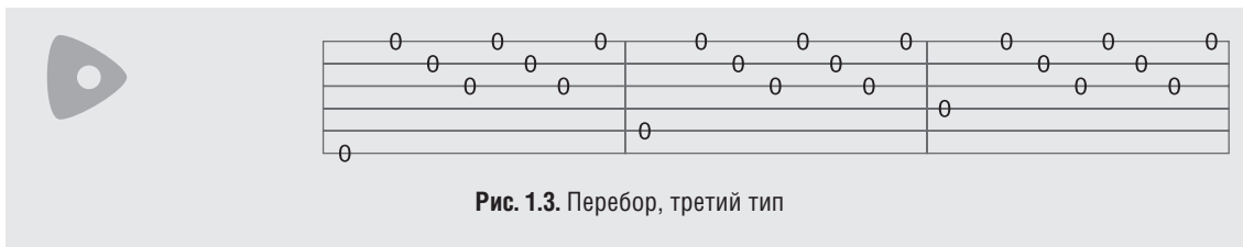
Рис. 1.3. Перебор, третий тип

Очередность действий следующая: большой палец дергает шестую струну, безымянный — первую, средний — вторую, указательный — третью. Затем снова безымянный — первую, средний — вторую, указательный — третью и безымянный — первую.