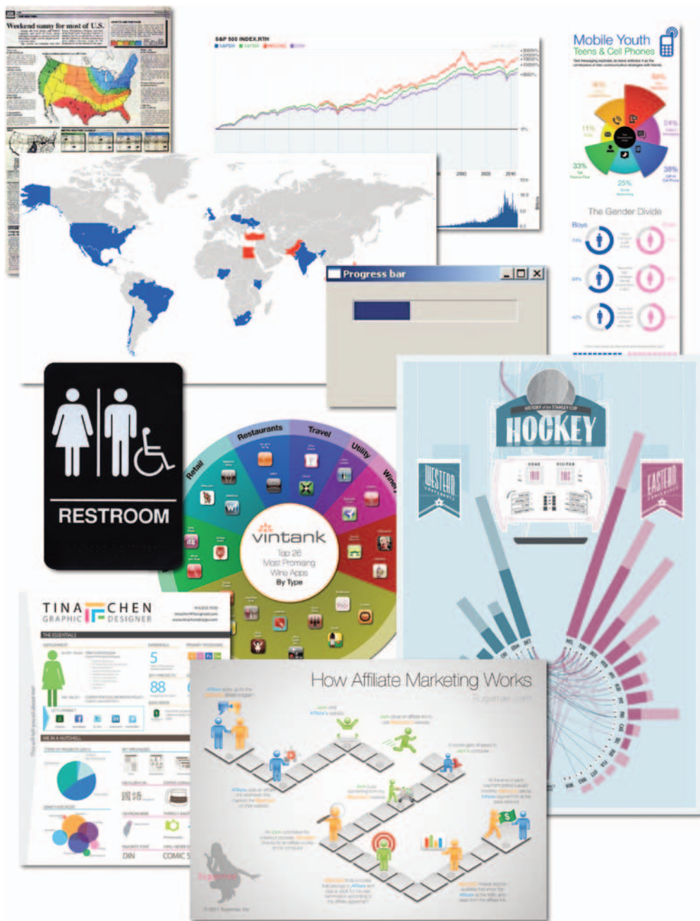
РИС. 1.2. Инфографика и варианты визуализации данных. Коллаж