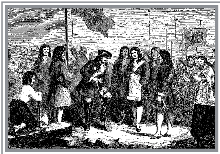
Неизвестный художник. Закладка крепости Санкт-Петербург

ставить на ремонт. Верфь нужна была вблизи моря. И нужна была как можно скорее. Петр I спешил и все-таки целую неделю потратил на поиски места — объехал в шлюпке все бухты, все заливы в пределах будущего города. И наконец выбрал: на левом берегу Невы, наискосок от Заячьего острова, напротив Васильевского. Нева здесь широка — спускать на воду суда со стапелей сподручно. К тому же издавна стояла там деревушка Гавгуево, а люди ведь на топком болоте жить не станут: выберут место посуше, понадежнее. Так что «приют убогого чухонца» помог царю сориентироваться.