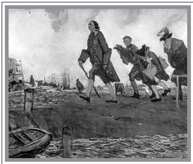
В. А. Серов. Петр Великий. 1907 г.

исповеди — сообщали о готовящихся преступлениях, о которых узнают на исповеди. А преступлениями в первую очередь признавали любые действия против царя и его реформ. Коснулись петровские преобразования и верующего люда. Если раньше ходить в храм, исповедоваться человек мог по велению сердца, то теперь это стало обязанностью, за исполнением которой строго следили: в церкви Петр видел своего рода школу воспитания нравственности, так что пропускать занятия в этой школе было не должно. Таким образом, царь не только подчинял церковь интересам государства, но и привлекал к посещению храмов все новых и новых прихожан.