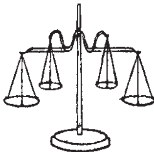
Рис. 1.1. Рука человека похожа на четырехчашечные весы

Из приведенной схемы следует, что средний палец господствует над другими. Этот вывод согласуется и с астрологическим подходом, который рассматривает средний палец как подчиненный мрачному Сатурну, или Хроносу. Средний палец (Сатурн) означает предопределение, судьбу человека; безмянный (Аполлон, или Солнце) — склонность к какому-либо виду искусства; мизинец (Меркурий) — предрасположенность к наукам; указательный (Юпитер) — стремление к материальным благам; большой (Венера) — отношение к чувственной стороне жизни (любви, боли и т. д.) (рис. 1.2).