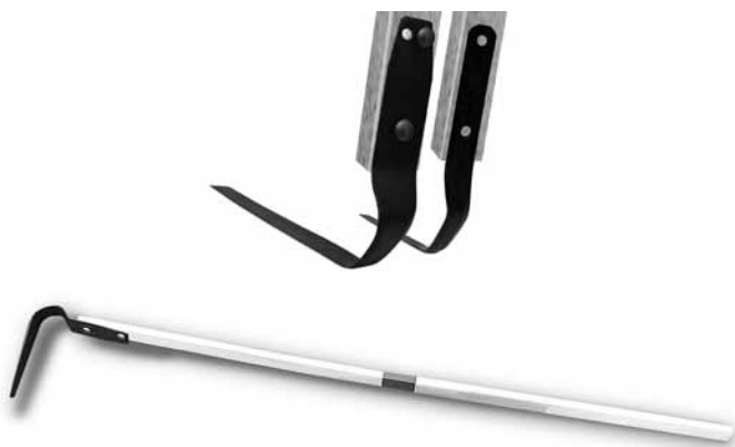
Рис. 1. Плоскорез Фокина

Вполне естественно, что первым в моем арсенале появился набор плоскорезов Фокина — большой и малый. Их оказалось очень просто заказать через рекламу в газете. Так и хлопот меньше, и, что очень важно, гарантия подлинности инструмента имеется. Конечно, освоил я непривычную работу не сразу: поначалу не все удавалось. А что вы хотите — инструмент для меня абсолютно новый и технологии обработки непривычные. Зато когда появились навыки правильного обращения с плоскорезами, все пошло как по маслу. И это, уважаемые читатели, вовсе не литературная метафора — удобный и надежный инструмент входил в необрабатываемую много лет землю, что твой нож в масло, взрыхляя почву, удаляя сорняки и формируя грядки. Да, чуть не забыл: при выполнении этих операций я пользовался большим плоскорезом — фронт работ большой, излишней ювелирности пока не требовалось.