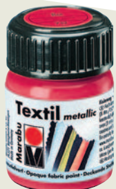
Акриловая краска по ткани