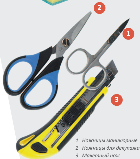
1 Ножницы маникюрные 2 Ножницы для декупажа 3 Макетный нож