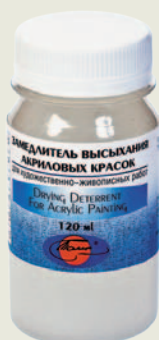
Замедлитель высыхания акриловых красок