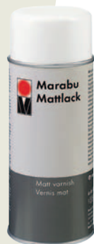
Матовый алкидный лак-спрей