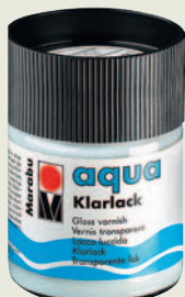
Глянцевый акриловый лак