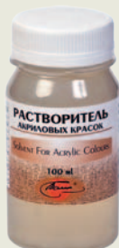
Растворитель акриловых красок