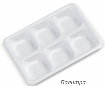
Палитра для смешивания красок