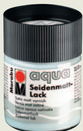
Полуматовый акриловый лак