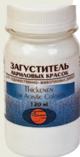
Загуститель акриловых красок