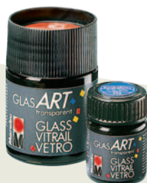
Акриловая краска по стеклу