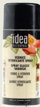
Глянцевый алкидный лак-спрей