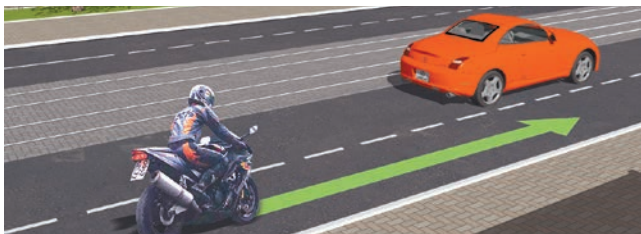
Опережение не подразумевает выезд на соседнюю полосу и может осуществляться и слева и справа

« Опережение » — движение транспортного средства со скоростью, большей скорости попутного транспортного средства.