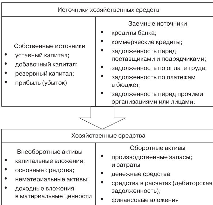
Рис. 1.1. Состав хозяйственных средств и их источников