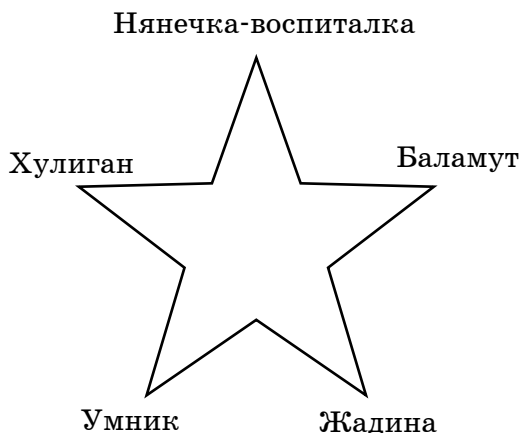
Рис. 2. Звезда архетипов в шуточной форме

и «умник». И, наконец, в каждом присутствует та самая «нянечка-воспиталка», которая поставлена следить за всем этим «детским садом».