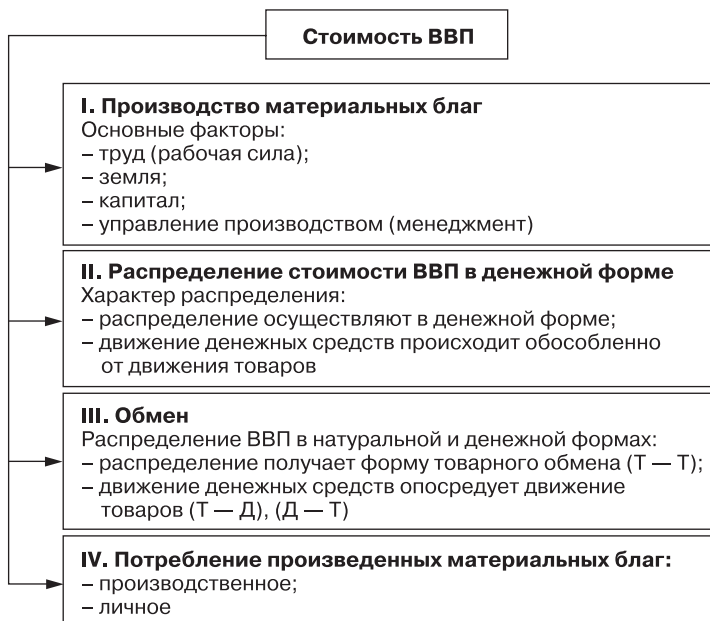
Рис. 1.1. Движение ВВП по стадиям (фазам) воспроизводственного процесса

2. Финансовые ресурсы используются через денежные фонды специального назначения, хотя возможна и нефондовая форма их расходования — например, сметная форма финансирования в бюджетных учреждениях. Фондовая форма функционирования финансовых ресурсов позволяет: