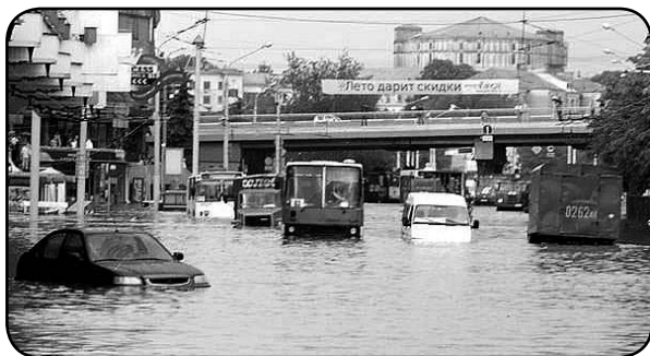
Рис. 1.3. «Утопленники»

Но проверка VIN-кода эффективна в основном только для автомобилей из США и Канады, в то время как на необъятных просторах России по большей части популярны бывшие в употреблении европейские и японские марки. И уже нет отчета системы CARFAX, который в подробностях расскажет о предыдущих владельцах автомобиля, о пробеге и ремонтах, то есть обо всем, что хочет (и должен) знать любой человек, покупающий машину. К тому же «русалочки» встречаются и в тех местах, где о море только читали в детских сказках. Обратите внимание на фотографию (рис. 1.3). Этот снимок сделан в центре Минска — далеко не морского города. И тем не менее.