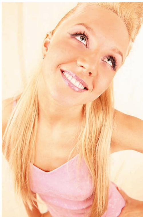
Рис. 1.1. «Весенний» тип внешности