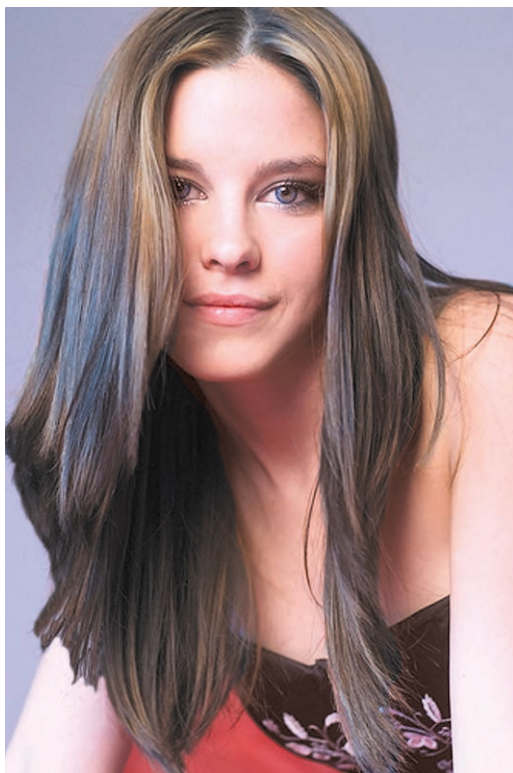
Рис. 1.2. «Летний» тип внешности

Людей, принадлежащих к «летнему» типу внешности, отличает цвет кожи, который варьируется от светлого до оливкового, но обязательно с голубоватым «подкожным свечением». В отличие о «весенних» людей, у которых после загара кожа приобретает красноватый оттенок, кожа «летних» под солнечными лучами приобретает ореховый оттенок. Что касается волос, то их цвет может быть как светлым, так и коричневатым, но всегда с пепельным оттенком. Многим представительницам такого типа внешности кажется, что цвет волос абсолютно не подходит им именно из-за пепельного оттенка, и они постоянно экспериментируют с красками. Цвет глаз у «летнего» типа может быть светло-голубым, серым, серо-голубым или светло-зеленым (рис 1.2).