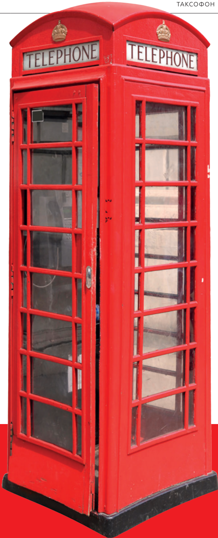
1930 Таксофон Western Electric. США