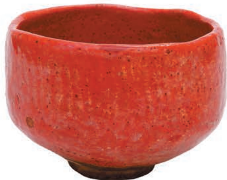
Тэяван ака-ранку Япония, XVIII век

Интересно, что в турнирах должны были обязательно присутствовать китайские вещи — настенные свитки, вазы, куда ставились цветы, курильницы для благовоний. Накрывался стол с лёгкими закусками. После угощения и прогулки все возвращались в павильон, где им подавался чай — чашка за чашкой. Нужно было отгадать сорта чая и выбрать лучшие. Те, кто угадывал больше сортов, получали специальный приз.