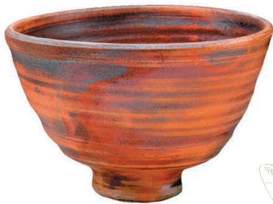
Тэяван в стиле «тэммоку»

Усилия монаха не прошли даром, чай стал популярным напитком, его полюбили самураи, военное сословие Японии. Были выращены первые чайные плантации в городе Удзи около Киото — до сих пор там растут лучшие сорта японского чая.