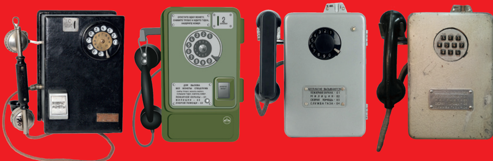
1932 Таксофон. СССР

К 1941 году в Москве насчитывалось 2775 телефонов-автоматов. А через сорок лет, в 1982 году, их стало в десять раз больше — 27 800. И сегодня на улицах можно встретить таксофоны. Конечно, за столетие своего существования они сильно изменились. Самые совершенные из них обладают массой возможностей — от отсылки факсов до выхода в интернет.