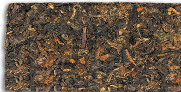
Плитка прессованного чая

Испокон веков Тибет славился своими выносливыми лошадьми, которые были необходимы китайской армии. Поэтому Тибет стал обменивать лошадей на чай. Чайный путь пролегал между Лхасой, столицей Тибета, и китайской провинцией Сычуань.