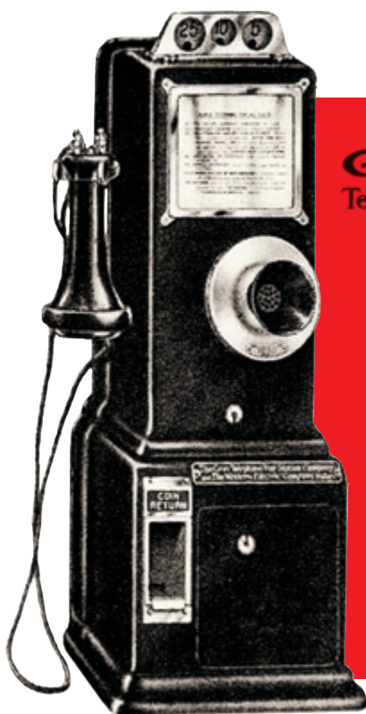
GRAY Telephone Pay Stations

Первый телефон-автомат Уильяма Грея был далёк от совершенства. Главный его недостаток заключался в том, что разговор надо было оплачивать после его завершения, и многие стремились уйти, не расплатившись. Но Грея трудности не обескуражили. Через несколько лет он усовершенствовал своё изобретение, и с тех пор во всех таксофонах оплачивают разговор заранее. Получив 23 патента на телефоны-автоматы, Грей в 1891 году создал свою телефонную компанию. Дело оказалось прибыльным, ведь к 1902 году в США была уже 81 тысяча телефонных автоматов.