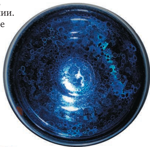
Тэяван — чашка-пиала для японской церемонии

В XII веке в моду у самураев вошли чайные турниры. Эту традицию воины подхватили у монахов и развили до настоящего ритуала.