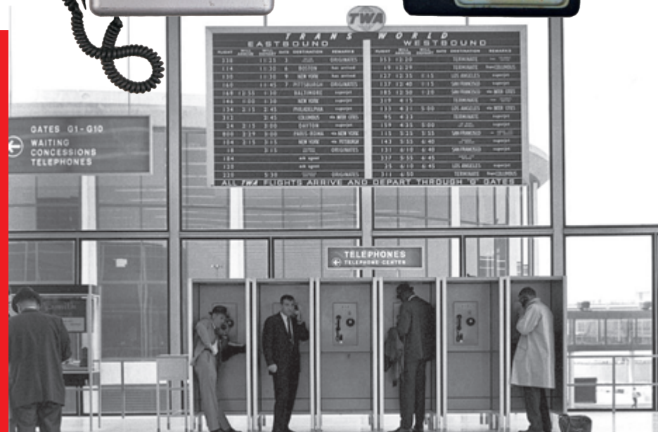
1963 Таксофоны в аэропорту О'Хара в Чикаго, США