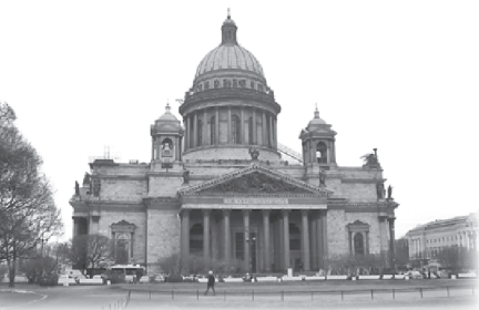
Вид на Исаакиевский собор с Исаакиевской площади

Комиссию по перестройке Исаакиевского собора. Председателем первого состава комиссии был назначен член Государственного Совета Н. Н. Головин. Членами комиссии стали министр народного просвещения А. Н. Голицын и председатель Комитета строений и гидравлических работ, выдающийся архитектор и инженер испанского происхождения Августин Августинович Бетанкур (1758–1824), которому поручили осуществлять технический