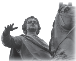
Лицо Петра I вылетела М. Колло

себя как хороший ученик знаменитого француза.