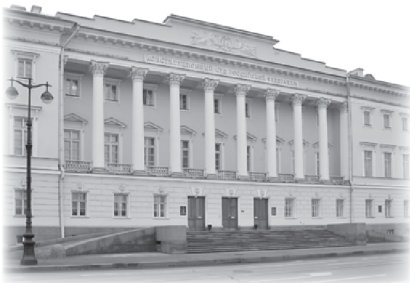
Здание Сената и Синода на площади Декабристов

коллегии, государственного органа, управлявшего религиозными делами, Петр I завершил огосударствление Русской православной церкви, полностью подчинив ее интересам государства и ликвидировав патриаршество. Только в революционном 1917 г., после свержения Николая II, патриаршество было восстановлено. Здания Сената и Синода России связали торжественной аркой, переброшенной через Галерную улицу. Фасад здания украшают фигуры