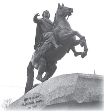
Знаменитый Медный всадник