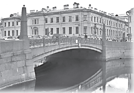
Красный мост через реку Мойку

на, ныне Российского государственного педагогического университета имени А. И. Герцена. Это набережная реки Мойки, 48. Экскурсанты узнают, что во дворце и в прилегающем к нему саду молодая супруга наследника российского престола Петра Федоровича, которую по прибытии в Россию крестили и стали именовать Екатериной Алексеевной, скучала от невнимания мужа, обрела немало преданных сторонников. чтобы впоследствии стать российской императрицей Екатериной II. Долгое время на Мойке, 48 находился воспитательный дом для детей, которых оставляли в чугунной люльке, стоявшей у ворот заведения. В 1918 г. был основан Третий государственный педагогический институт, в который со временем влились все остальные педагогические вузы города, но в постсоветский период историю РГПУ им. А. И. Герцена стали вести с 1797 г. Перед главным зданием университета стоит памятник Константину Дмитриевичу Ушинскому, одному из крупнейших деятелей российской педагогики. В силу различных обстоятельств памятник Александру Ивановичу Герцену так и не был установлен.