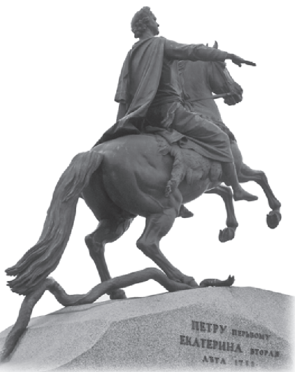
Кумир на бронзовом коне

А первым постоянным мостом стал Благовещенский, построенный в правление Николая I под руководством выпускника Института Корпуса инженеров путей сообщения Станислава Валериановича Кербедза. Постоянный мост назвали Благовещенским по имени церкви, находившейся на предместной площади. Это чудо строительного искусства соединило Васильевский и Адмиралтейский острова. В этом месте Нева имела ширину в 280 м. Мост в то время был самым протяженным