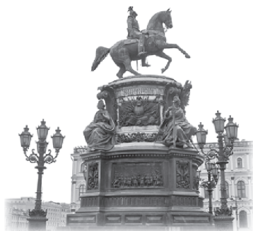
Памятник Николаю I. Вид справа

В центре Исаакиевской площади установлен великолепный памятник Николаю I, правившему в 1825–1855 гг., спроектированный архитектором Огюстом Монферраном в 1856 г. Мастер конной скульптуры Петр Карлович Клодт изобразил императора в мундире конногвардейского полка. Каска, увенчанная двуглавым орлом, надвинута на глаза. Высокие сапоги-ботфорты и палаш на боку дополняют образ тщеславного, жестокого монарха, завершившего свое правление провальной Крымской войной (1853–1856).