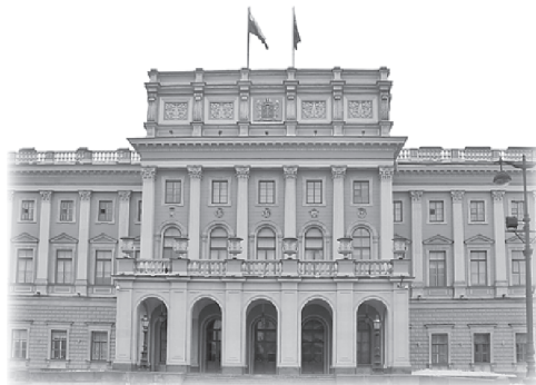
В Мариинском дворце находится Законодательное собрание Санкт-Петербурга

Николай I «скачет» прямо на Исаакиевский собор, который строился на протяжении сорока лет (1818–1858) во времена его правления (1825–1855). В 1818 г. император Александр I одновременно с утверждением проекта Монферрана учредил особую