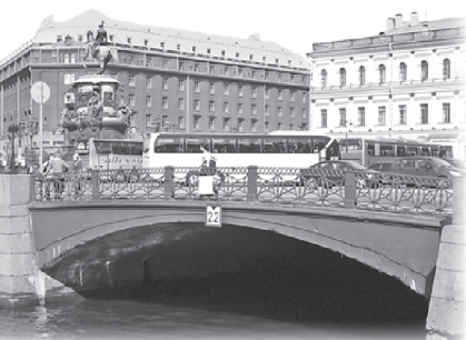
Синий мост — часть Исаакиевской площади

Через реку Мойку напротив РГПУ им. А. И. Герцена находится Санкт-Петербургский государственный университет телекоммуникаций имени профессора М. А. Бонч-Бруевича, ведущий свою историю с 1930 г. Михаил Александрович Бонч-Бруевич (1888–1940) был известным русским и советским радиотехником, основателем отечественной радиоламповой промышленности. В 1918–1928 гг. он руководил научно-техническими разработками в знаменитой Нижегородской лаборатории. С 1928 г. работал в Центральной радиолaborатории Треста заводов слабых токов Ленинграда, вел препода-