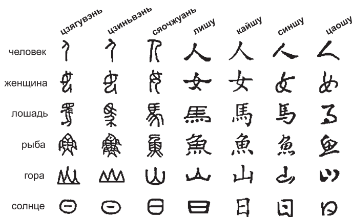
Рис. 2. Эволюция стилей китайского письма

Во-первых, были сделаны попытки определить количество иероглифов, необходимых для всеобщего употребления. Опытным путем было установлено, что в учебных текстах, а также детской и популярной литературе употребляется около 4300 знаков (при общем их количестве около 50 тыс.). Эта норма признается до сих пор.