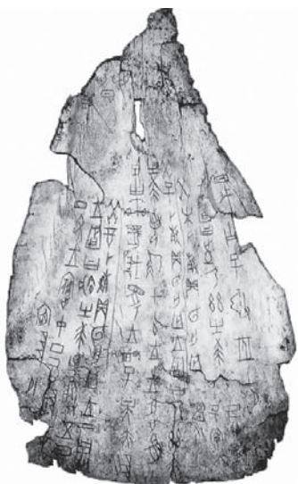
Рис. 1. Цзягувэнь

Также при династии Чжоу (XI–III вв. до н. э.) стала активно расширяться сфера применения китайской письменности, расширялся круг людей, ей владеющих, стали создаваться новые знаки, увеличился запас знаков, которым активно пользовались грамотные люди. Однако в те времена не существовало единой формы письменных знаков, в различных частях Древнего Китая иероглифы писались по-разному. Первым известным опытом кодификации графического китайского письма является список иероглифов Ши Чжоу-пянь «Книга историографа Чжоу», составленный в эпоху западной династии Чжоу.