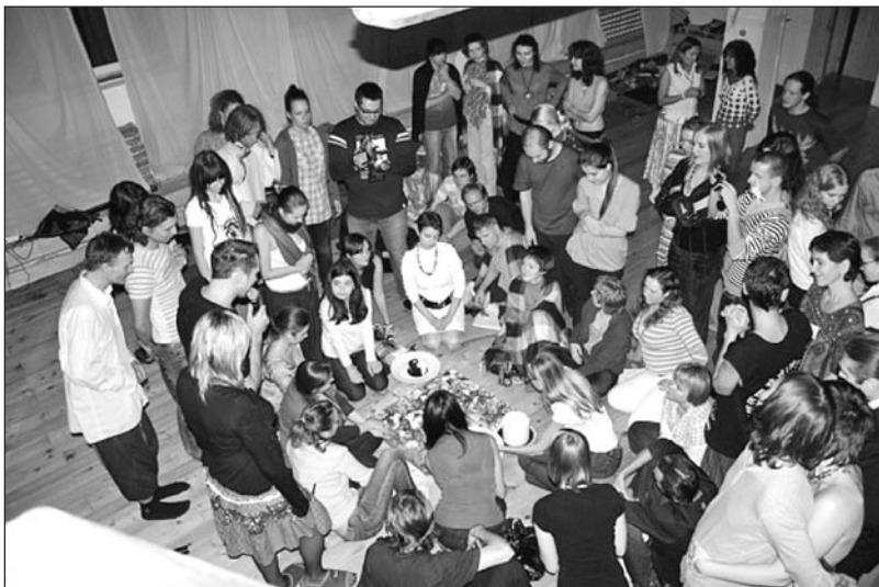
Фруктовая мандала на «Вега-Пати» в Москве, октябрь 2010 г.

в стоимость входит один свежевыжатый сок на выбор и угощение. Все остальное можно приобрести в сыроедческом баре. Многие салаты, соусы и напитки готовятся на глазах участников. Можно узнать новые рецепты и внести разнообразие в свой сыроедческий рацион.