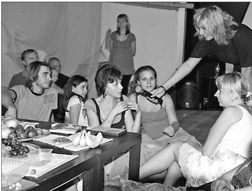
На сыроедческом потлаке в Москве, август 2010 г.

Каждый предпоследний четверг месяца в уютном клубе проходят встречи сыроедов. Здесь можно ходить босиком, чувствовать себя раскованно и свободно, делиться интересной информацией, находить новых друзей, слушать выступления авторов книг, посвященных сыроедению.