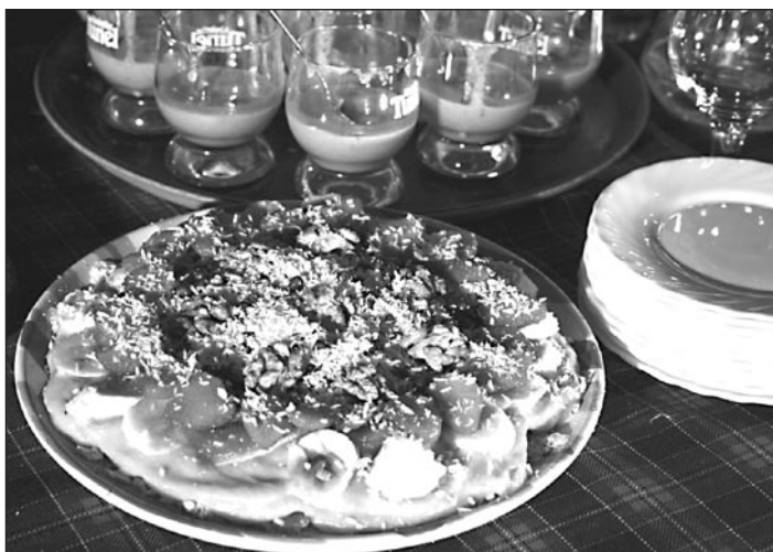
Десерты из сыроедческого меню бара «Лентяй»

Передаю горячий привет владельцам и персоналу всех кафе, в которых заботятся о здоровье посетителей, не травят их алкоголем и синтетическими продуктами, а кормят натуральной пищей.