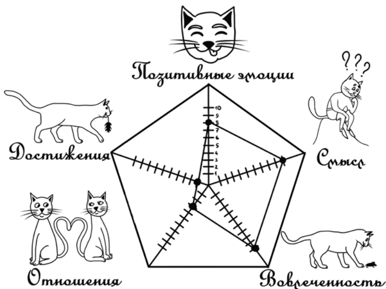
Рис. 5. Оценка наличия элементов процветания в жизни Кота в сапогах

У вас получится какая-то фигура. Вот такая фигура, например, появилась в свое время у нашего героя, Кота в сапогах.